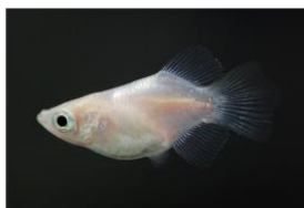
ヒレの小さい個体