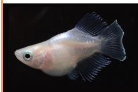
ヒレの大きい個体

メダカ全体型にもいえることですが、特にヒカリダルマ体型はヒレが大きいほど魅力ある個体になります。図のメダカは体色、体型、ヒレの色など、ほとんど変わらない個体を選んでいます。ヒレが大きいだけで左のメダカの方が魅力ある個体に見えます。